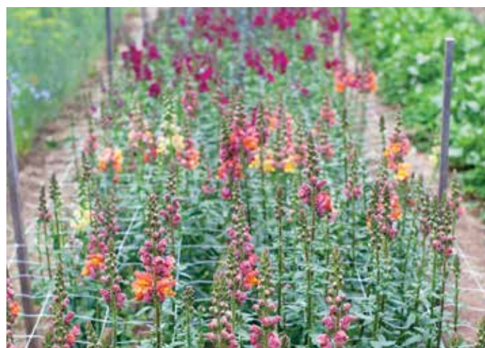
FIGURA 5. La malla ayuda a asegurar tallos rectos en los dragones (Hortonova trellis, Peaceful Farm Supply).

Una dilución de algas marinas en líquido promueve el robustecimiento de las hojas y del tallo, lo que conduce a tallos más largos, robustos, y resistentes. Es fácil de usar en combinación con una fuente de nitrógeno en líquido tal como la emulsión de pescado o un producto a base de soya. Haga aplicaciones foliares semanales usando una rociadora o aspersora de mochila para la mayoría de las flores de corte. Deje de fertilizar una vez establecido el crecimiento vegetativo a fin de no retrasar la floración o el desarrollo de tallos y flores que se caen o dañan con facilidad. Tenga en cuenta que los girasoles no deben recibir fertilidad suplementaria;