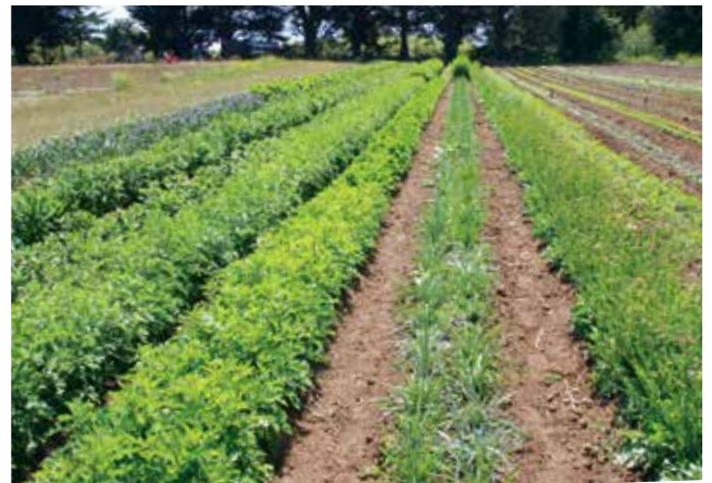
FIGURA 3. Bloque de plantaciones de flores de corte.