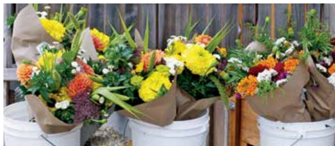
FIGURA 10. Ramos para miembros de una CSA ya listos para ser recogidos por los clientes.

Una vez establecidas, las plantas perennes herbáceas no requieren de labranza anual y le ganan la competencia a las