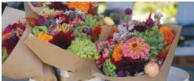
Ramos de otoño.

Otño: Amaranth/Amarantus , Flowering Basil/ Flor de Albahaca , Gomphrena , Rudbeckia , Sweet Annie