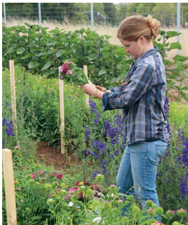
FIGURA 8. Manojos y amarres de ramilletes de una sola especie.