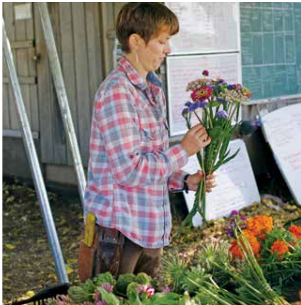
FIGURA 11. Apile las flores en una superficie limpia.