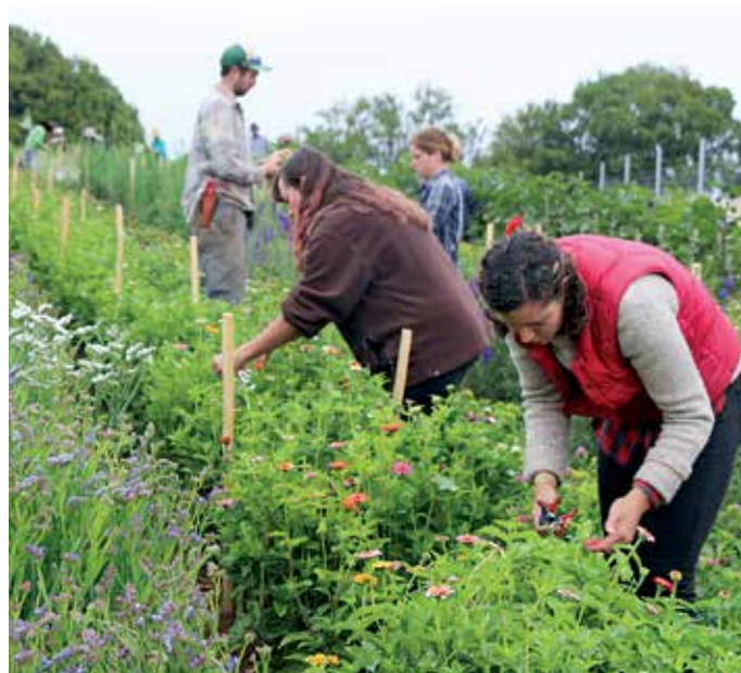
FIGURA 7. Las cosechas en la madrugada aprovechan el hecho de que la temperatura interior de las flores es más fresca.

Si la cosecha ocurre al mediodía, mantenga abundante agua en las cubetas, y coloque las flores rápidamente en un frigorífico o espacio fresco para que se mantengan frescos con éxito.