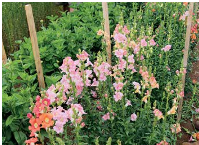
FIGURA 6. Estacas y cuerdas apoyan flores de corte.

Muchas especies de flores se benefician cuando la punta de crecimiento (meristemo apical) de la planta se poda para estimular la ramificación y desarrollo de múltiples capullos. Vea la Tabla 2 para una lista de variedades de flores que deben ser podadas, así como las que no debe de podar.