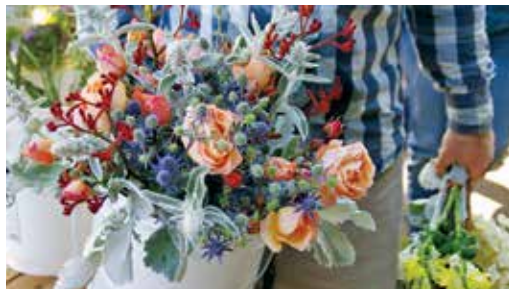
FIGURA 4. Una mezcla con flores principales y ramitas de relleno, de follaje, y flores de acento