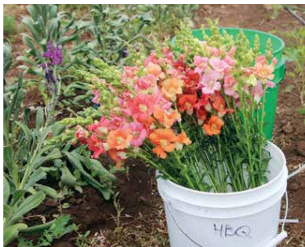
FIGURA 9. Los tallos largos reducen el riesgo de ser dañados.