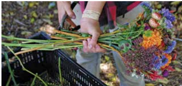
FIGURA 12. Corte los tallos a la misma longitud para anillar.