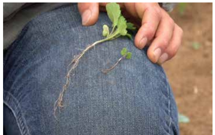
FIGURA 4. Elimine las malezas en su etapa pre-emergente (etapa de hilo blanco) y en cuanto las malezas aparezcan.

Al plantar en humedad, la capa de suelo encima de la cama debe ser despejada mecánicamente para que la sembradora pueda poner las semillas en suelo húmedo. Esta operación se hace más eficientemente con una reja de ala ancha (Alabama Shovel) montada en frente de la sembradora para que empuje el suelo seco a los lados en la superficie de la cama. Cuando se coloca correctamente, la reja debe dejar un canalillo en forma de "V" en el centro de la cama. El suelo debe contener suficiente humedad en la parte baja, para dar inicio a la germinación de la semilla recién sembrada.